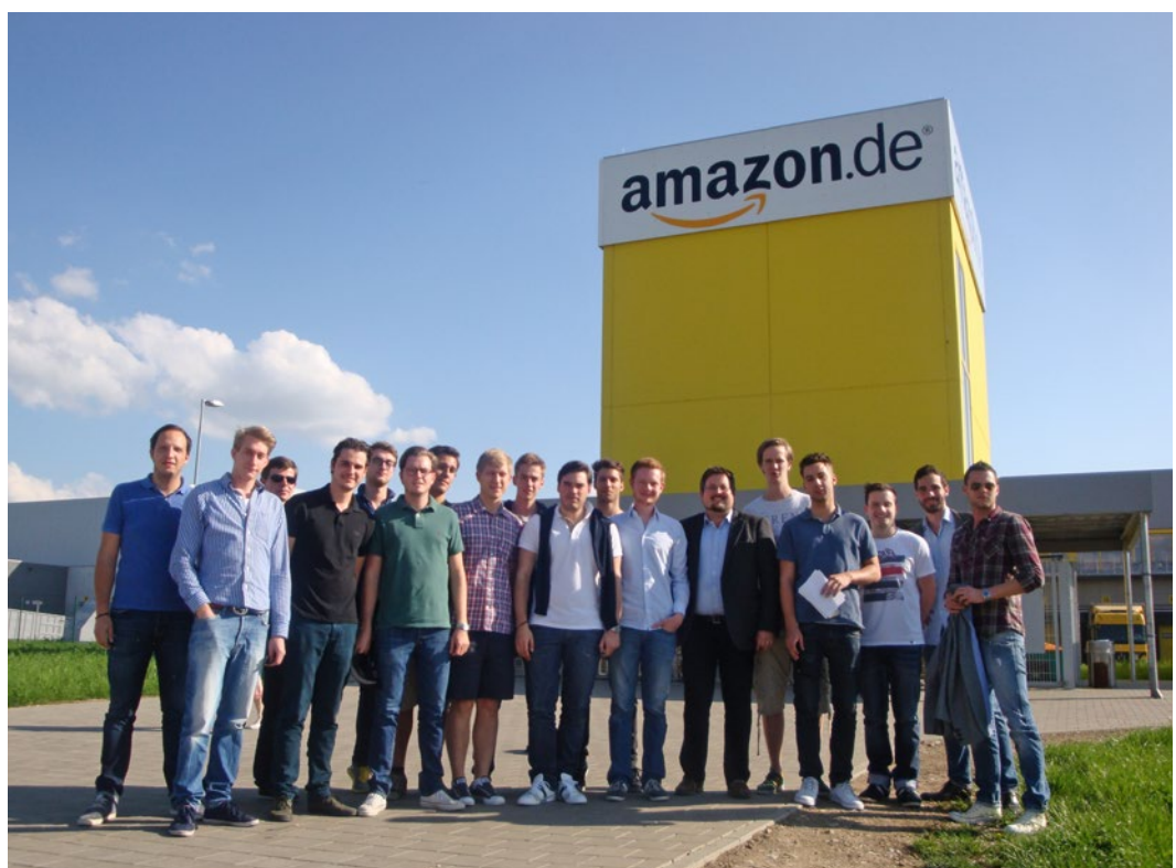
ISM-Studenten bei einer Exkursion zum Amazon Logistikzentrum Graben

Auf Wunsch erteilen wir Ihnen die Zugriffsrechte auf unsere Absolventendatenbank, in der Sie gezielt und zeitlich flexibel die Lebensläufe von examensnahen Studierenden und Jungabsolventen recherchieren und mit geeigneten Kandidaten direkt in Kontakt treten können.