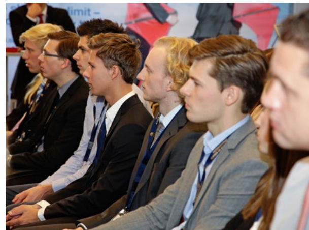
Besucher der Podiumsdiskussion beim ALEX Day 2013

Außerdem finden über alle Campi hinweg weitere Netzwerkveranstaltungen zu aktuellen wirtschaftlichen Themen und Fragestellungen statt. Wir informieren Sie hierzu gerne und stellen den Kontakt zur jeweiligen Campusleitung her.